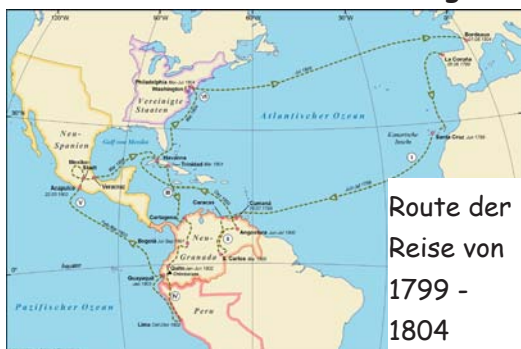
Route der Reise von 1799 - 1804

Er bringt 6300 unbekannte Pflanzen von seiner Reise mit. In den folgenden Jahren schreibt er über seine Reise ein 30-bändiges Werk.